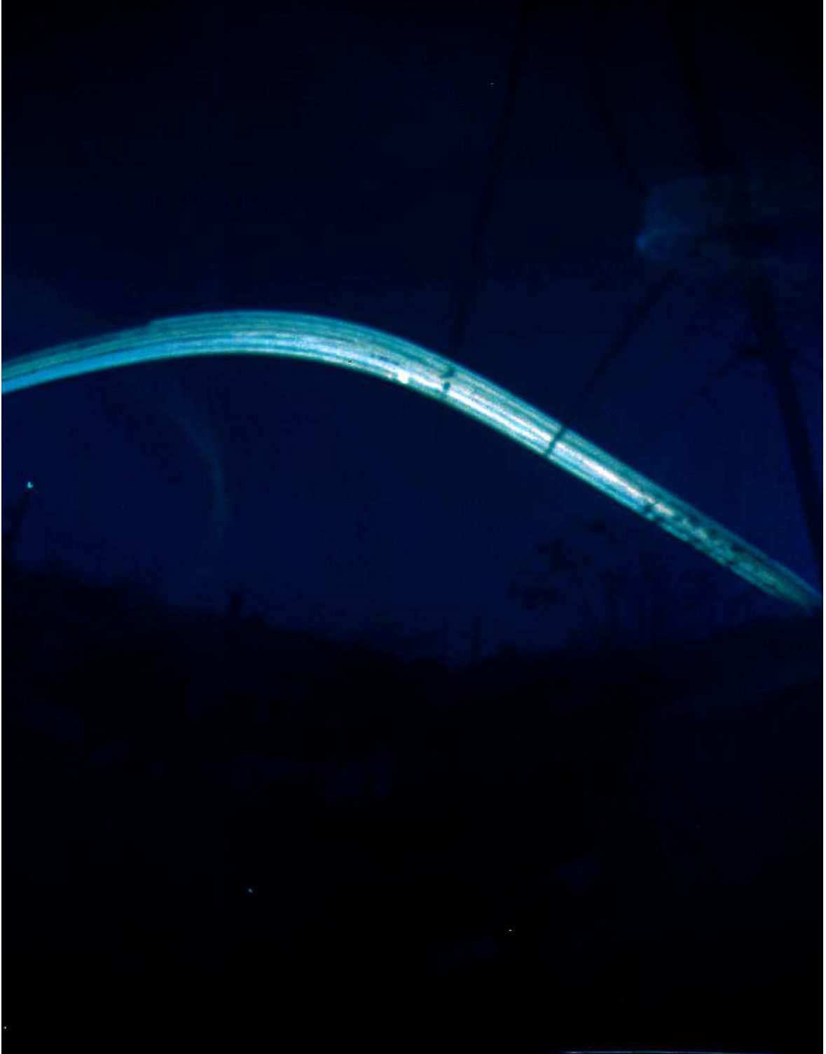
Con filtro azul, se aprecia mejor el camino aparente del Sol, y los intervalos que generan los días nublados y soleados.